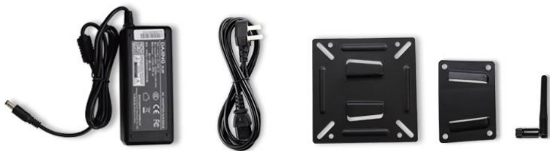
产品手册*1、保修卡*1、合格证*1、一体机*1、适配器*1、电源线*1、壁挂支架*1、WIFI天线*1